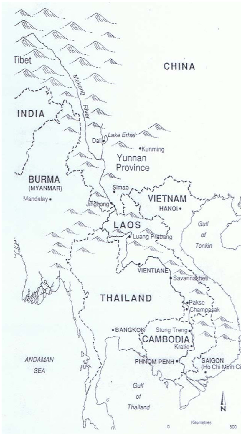
ภาพที่ 4 พื้นที่ศึกษาในกลุ่มน้ำโขงและสาละวิน